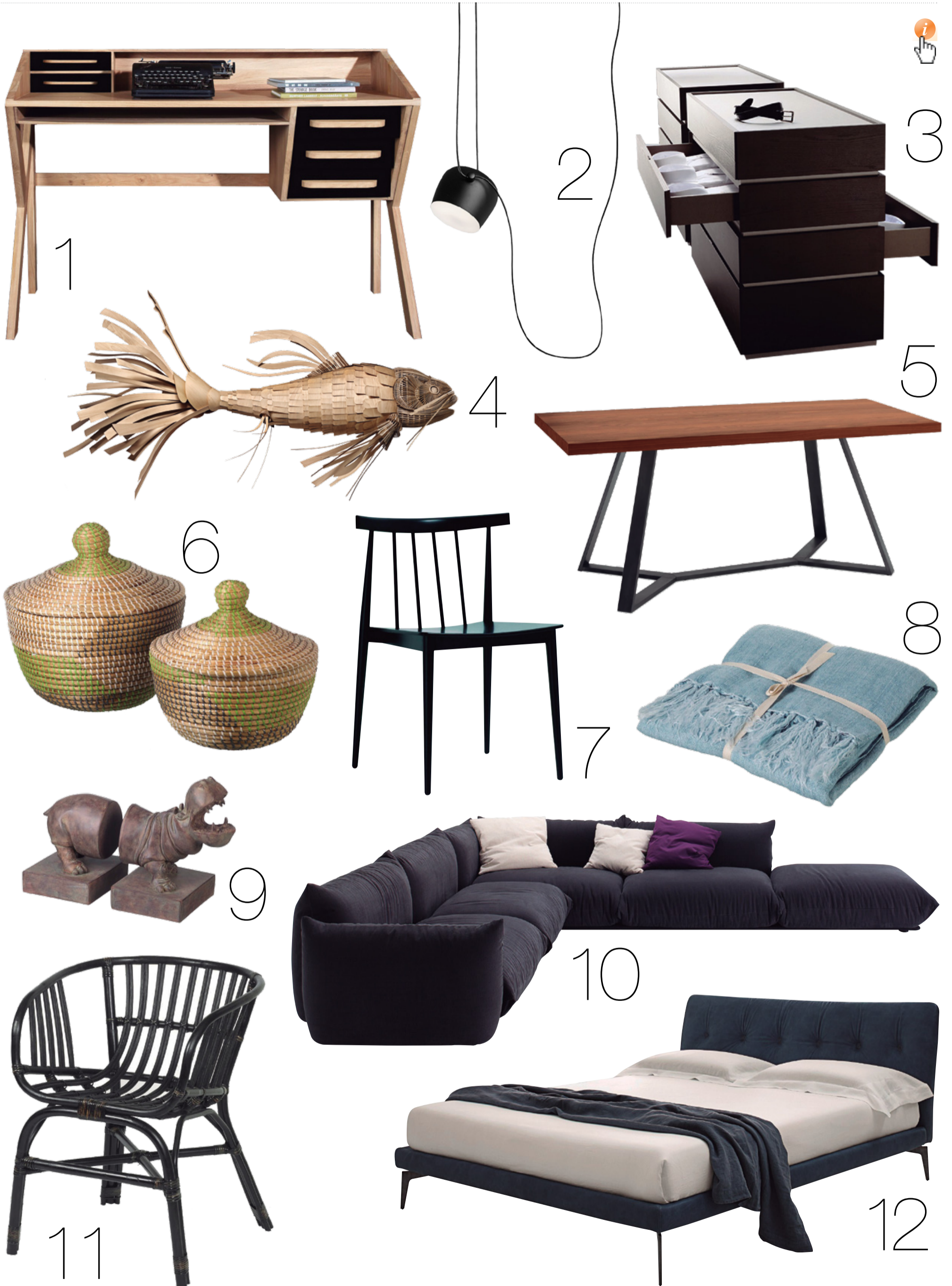
1. Escritorio Mod. "Origami" de Ethnicraft. 2. Mueble auxiliar cajonera Mod. Cidori de la firma Sangiacomo. 3. Lámpara Mod. "AIM" de Flos. 4. Lámpara Mod. "Koi" Wood de LZF. 5. Mesa Mod. "Archie" de Domitalia. 6. Cestas Mod. "Manila" de Parlane. 7. Silla Mod. "Smile" de Andreu World. 8. Foulard de lino de Parlane. 9. Sujeta libros "Hippo" de Parlane. 10. Sillón Chairs-long de Mario Marengo para Arflex. 11. Sillón mimbre Mod. "Lombok" de Parlane. 12. Cama Mod. "Arca" de Alivar.