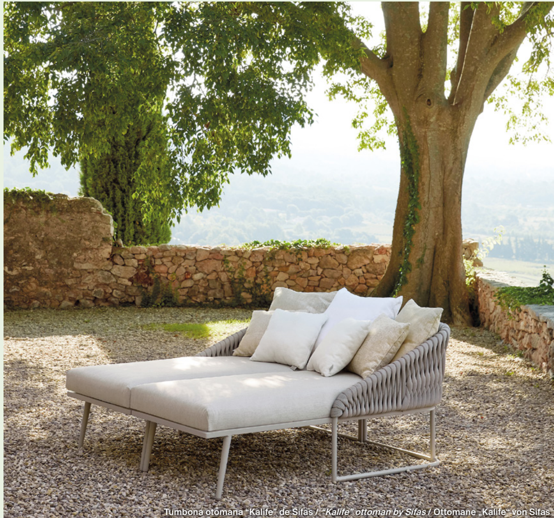
Tumbona otomana "Kalife" de Sifas / "Kalife" ottoman by Sifas / Ottomane „Kalife“ von Sifas

Bei allen Kollektionen favorisiert SIFAS ein zeitloses, modernes Design, das die Grenzen zwischen Innen- und Außenbereich aufhebt . So wird der Garten zu einem Wohnbereich unter freiem Himmel. Die folgenden Kollektionen sind bei DURAN erhältlich. KOMFY heißt die Serie dieser niedrigen, eleganten Wohnzimmermöbel, die dank ihrer fünf austauschbaren Elemente die individuelle Gestaltung Ihres Wohnzimmers erlaubt. BASKET , das widerstandsfähige Polyestergeflecht im lackierten Aluminiumrahmen, das Wetterunbilden widersteht und auch noch schön anzusehen ist. Und: KALIFE mit zwei Sofas, einem Sessel, einer Ottomane und einem Zweisitzer-Sofa und vielen Möglichkeiten für die individuelle Gestaltung Ihres Wohnzimmers.