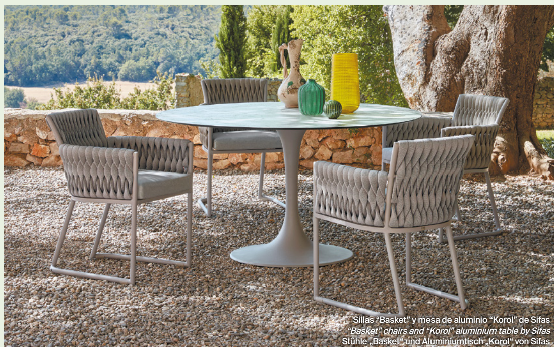
Sillas "Basket" y mesa de aluminio "Korol" de Sifas / "Basket" chairs and "Korol" aluminium table by Sifas / Stühle „Basket“ und Aluminiumtisch „Korol“ von Sifas