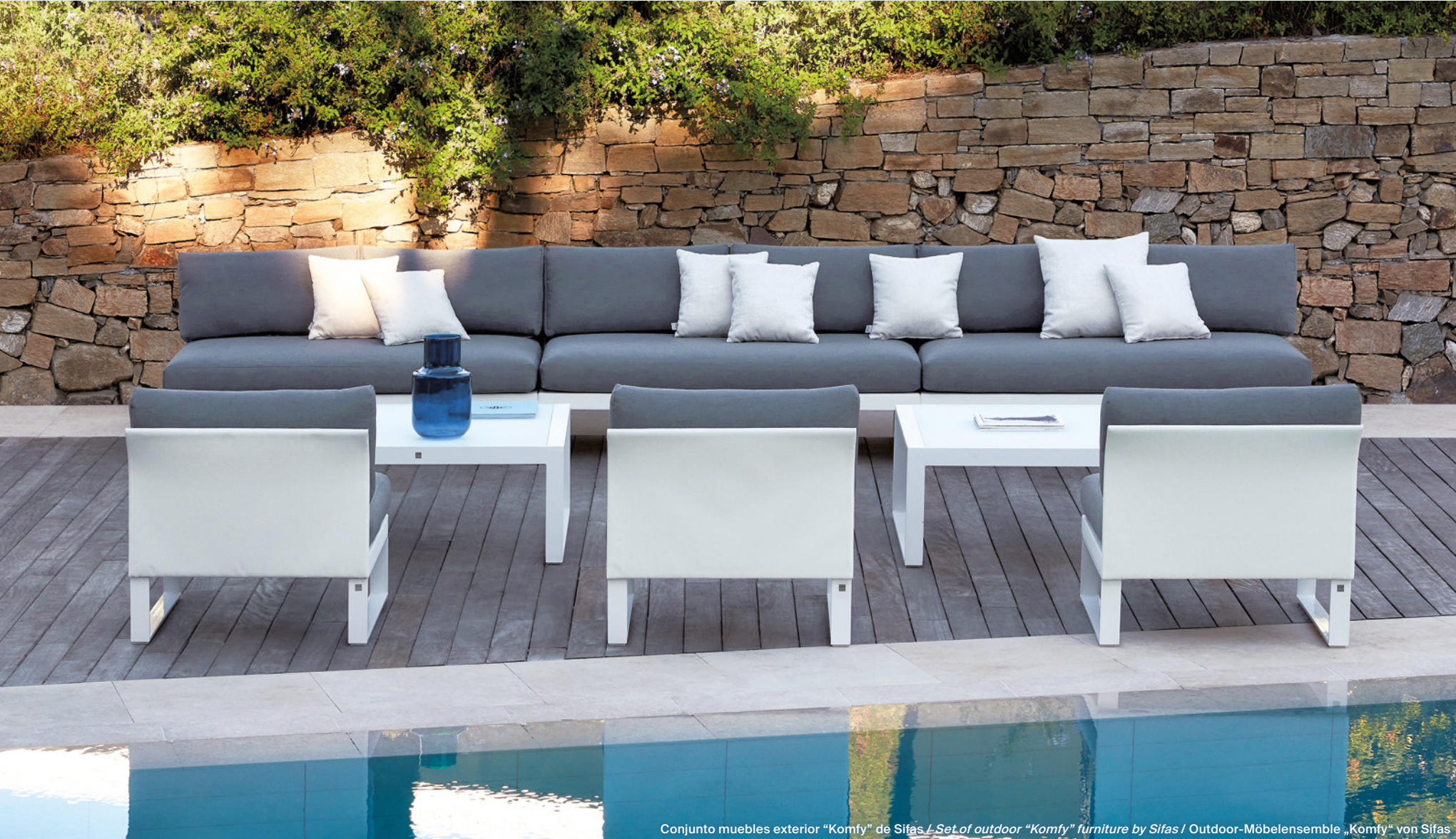
Conjunto muebles exterior "Komfy" de Sifas / Set of outdoor "Komfy" furniture by Sifas / Outdoor-Möbelensemble „Komfy“ von Sifas